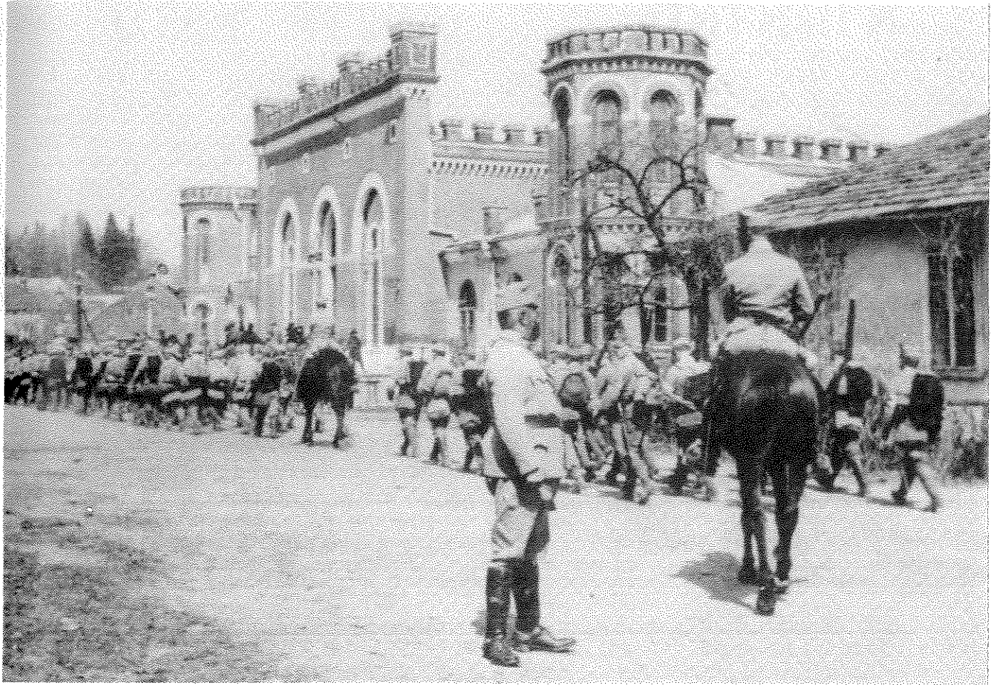
בית הכנסת של חצר סדיגורה בעיר הנושאת שם זה, בבוקבינה האוסטרית. התמונה צולמה בתקופת מלחמת העולם הראשונה והחייילים הם חיילי צבא הקיסר פרנץ־יוזף

מדיניות, טכנולוגיה והומור — מבשרת את ראשית הפנמת הצורות החיצוניות של העתונות הבין לאומית הלועזית בתוך כתבי העת העבריים.